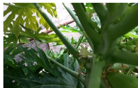
Фото. 2. Спелые плоды в разрезе. Фото. 3. Дынное дерево. Фото. 4. Цветочки дынного дерева